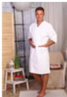
Халат Вафельный мужской

Отбелённый, 100% х/б. Плотность 200-242 г/м.